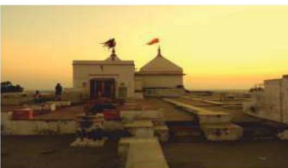
Jatipura Temple Mathura