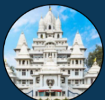
Pagal Baba Mandir