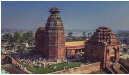
Sri Madan Mohan Temple