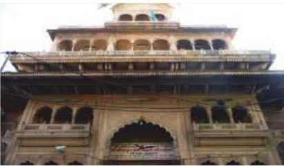
Sri Banke Bihari Ji Temple