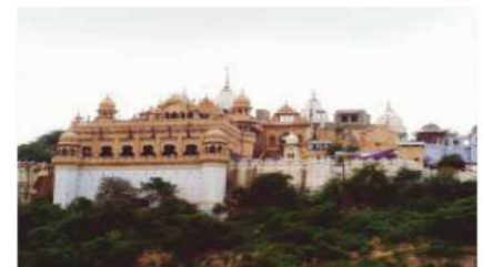
Radha Rani Mandir - Barsana