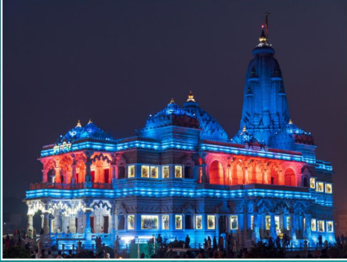
Prem Mandir - a Hindu temple of love, dedicated to the worship of Sri Krishna