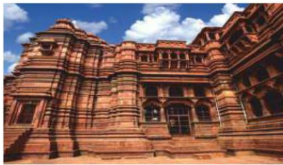
Govind Dev Temple