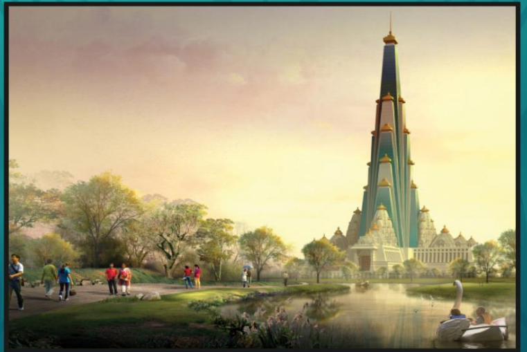
Chandrodaya Mandir temple at Vrindavan, Mathura, India.

वृंदावन चंद्रोदय मंदिर, एक भव्य मंदिर परिसर, जिसे उत्तर प्रदेश के मथुरा जिले में वृंदावन की पवित्र भूमि में स्थापित करने की योजना है, श्री कृष्ण और उनके पारलौकिक निवास, वृंदावन की महिमा को प्रसारित करने के लिए समर्पित है, जैसा कि श्रील प्रभुपाद ने सिखाया था। दुनिया भर में। इस्कॉन बैंगलोर के भक्तों द्वारा परिकल्पित यह परियोजना भारत में सबसे ऊंची मंदिर संरचना होगी - पारंपरिक भारतीय मंदिर और आधुनिक वास्तुकला का एक संयोजन - 700 फीट की ऊंचाई और 5,40,000 वर्ग फुट के निर्मित क्षेत्र के साथ। मंदिर परिसर में वृंदावन चंद्रोदय मंदिर, कृष्णा लीला पार्क, कृष्णा हेरिटेज म्यूजियम, कृष्णा वास और कृष्णा कुटीर रिट्रीट शामिल होंगे। इस प्रोजेक्ट में और भी कई आकर्षक विशेषताएं होंगी। एक कैप्सूल एलिवेटर आगंतुकों को ग्रहीय प्रणालियों के माध्यम से संरचना के शीर्ष पर देखने वाली गैलरी में ले जाएगा जहां एक लुभावनी ब्रज मंडल दर्शन हो सकता है। भारत की विविध संस्कृतियों में कृष्ण की समृद्ध विरासत और कलात्मक उत्सव को हजारों वर्षों से अभ्यास और सिद्ध किया गया, प्रदर्शित किया जाएगा। वृंदावन चंद्रोदय मंदिर का उद्देश्य भारतीयों के बीच एक जागृति लाना है और एक ऐसे राष्ट्र का प्रदर्शन करना है जो न केवल प्रतिभा, रचनात्मकता और ऊर्जा से भरा हो, बल्कि आध्यात्मिक विश्वदृष्टि द्वारा निर्देशित उदात्त मूल्यों और चरित्र से भी सुशोभित हो। वृंदावन चंद्रोदय मंदिर वृंदावन को विश्व मानचित्र पर लाने की इच्छा रखता है।