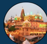
Krishna Janam Bhumi