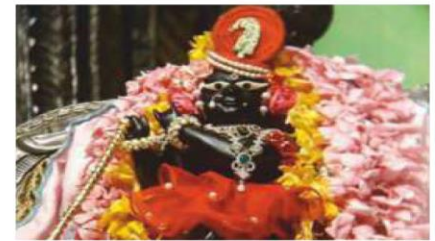
Sri Radha Raman Ji