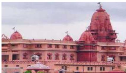
Krishna Janma Bumi